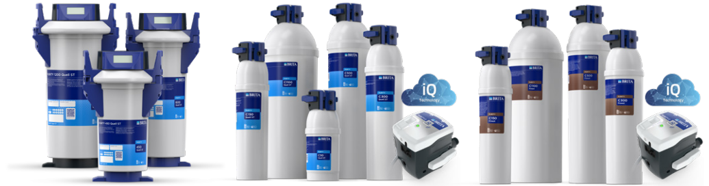
PURITY Quell ST

Hier sehen Sie das gesamte PURITY Filterportfolio speziell für den Einsatz in Getränkeautomaten auf einen Blick. Unabhängig von den lokalen Wassergegebenheiten bietet BRITA Professional mit PURITY für nahezu alle Situationen die passende Produktlösung, die auch für Ihre Anwendung das optimale Wasser bereitstellt.